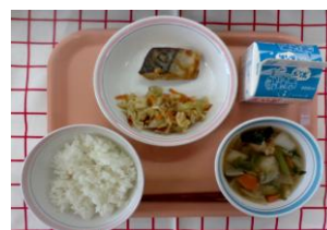
12月15日に実施 「江戸こがね汁」の献立