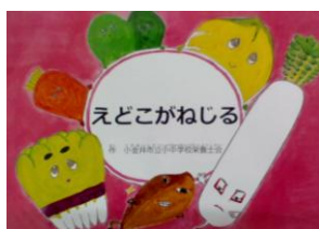
ピンクの表紙が目印 食育絵本「えどこがねじる」

12月12日に、東京小金井ロータリークラブ様より、食育絵本「えどこがねじる」をご寄付いただきました。小金井市立小中学校給食のオリジナルメニューである「江戸こがね汁」を基に、小金井市立小中学校栄養士会が絵本原画を作成し、東京小金井ロータリークラブ様が印刷と製本をしてくださいました。絵本は、前原小学校の図書室にもあります。江戸こがね汁のことがよく分かる一冊になっていますので、手に取って読んでももらえたら幸いです。