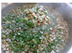
すいとんや野菜がたっぷり 「江戸こがね汁」調理中